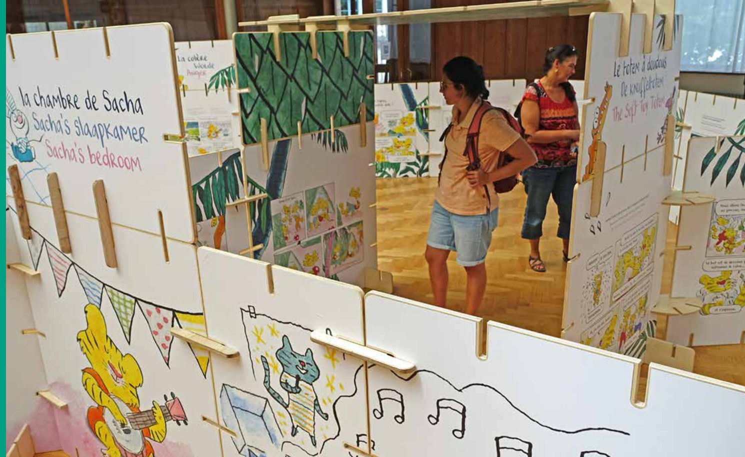
Daniel Fouss © 2024