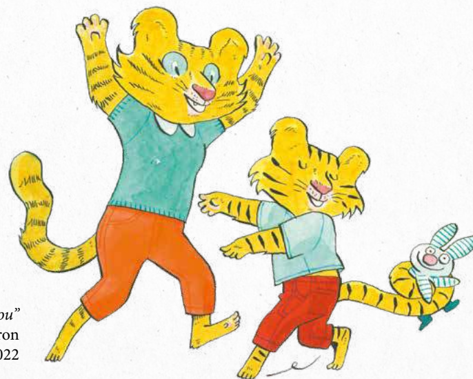
"Sacha et la colère du Graou" Alexandre de Moté et Joëlle Passeron © Glénat 2022