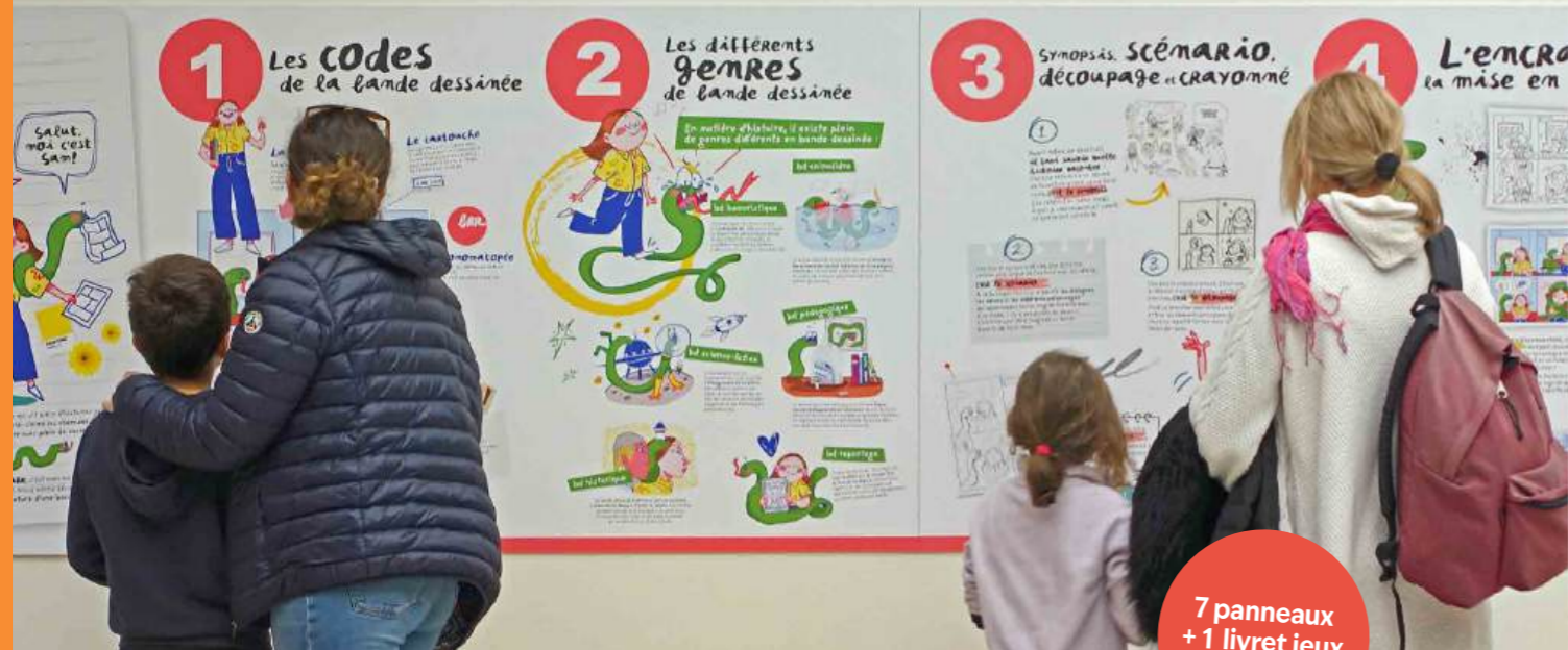
Daniel Fouss © 2024